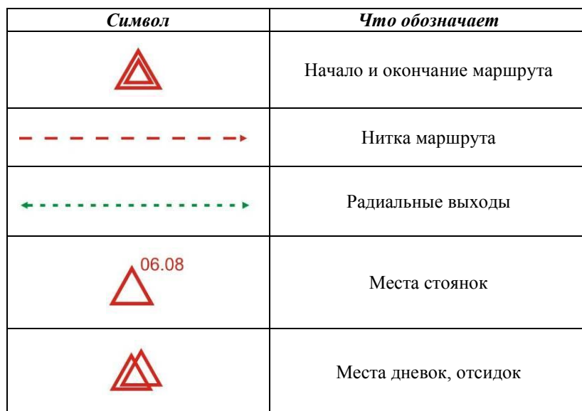
Таблица нестандартных условных обозначений, использованных группой при внесении изменений в карты