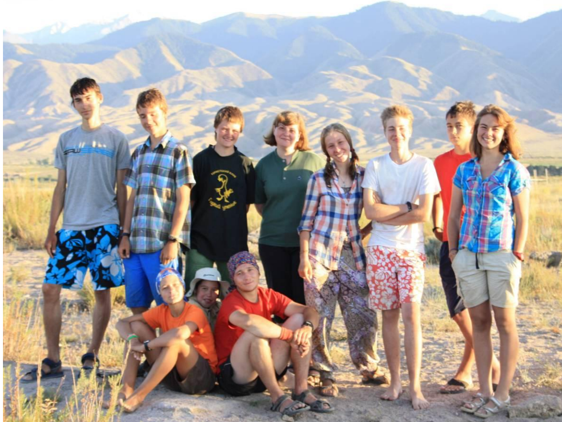
(Группа оз. Иссык-Куль.)